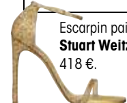
Escarpin pailleté, Stuart Weitzman, 418 €.

PAR CAPUCINE TERRIN / COORDINATION NEWS/MADAME SÉGOLÈNE WACRENIER, AVEC MARIE-SOPHIE N'DIAYE