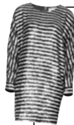
Robe en soie à sequins, Saint Laurent par Hedi Slimane, sur mytheresa.com, 5 990 €.