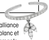
Bague alliance en or blanc et diamants, Perloia chez Colette, 1 555 €.