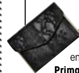
Pochette en similicuir, Primark, 7 €.