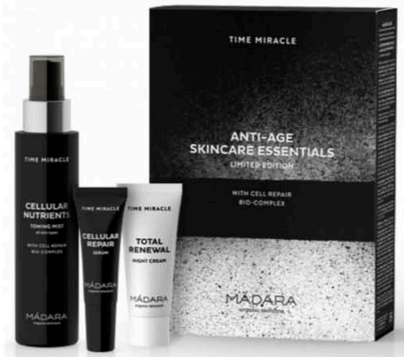
Les Crèmes & Sérums de Madara.