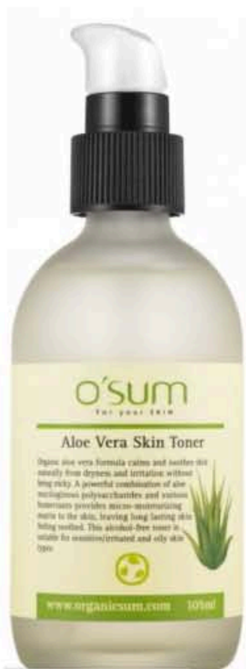
Le Sérum à l'Aloé Vera de O'Sum - 105ml / 18.50€

Et pas une certification nébuleuse, nan nan, c'est vraiment estampillé Ecocert (c'est marqué dessus).