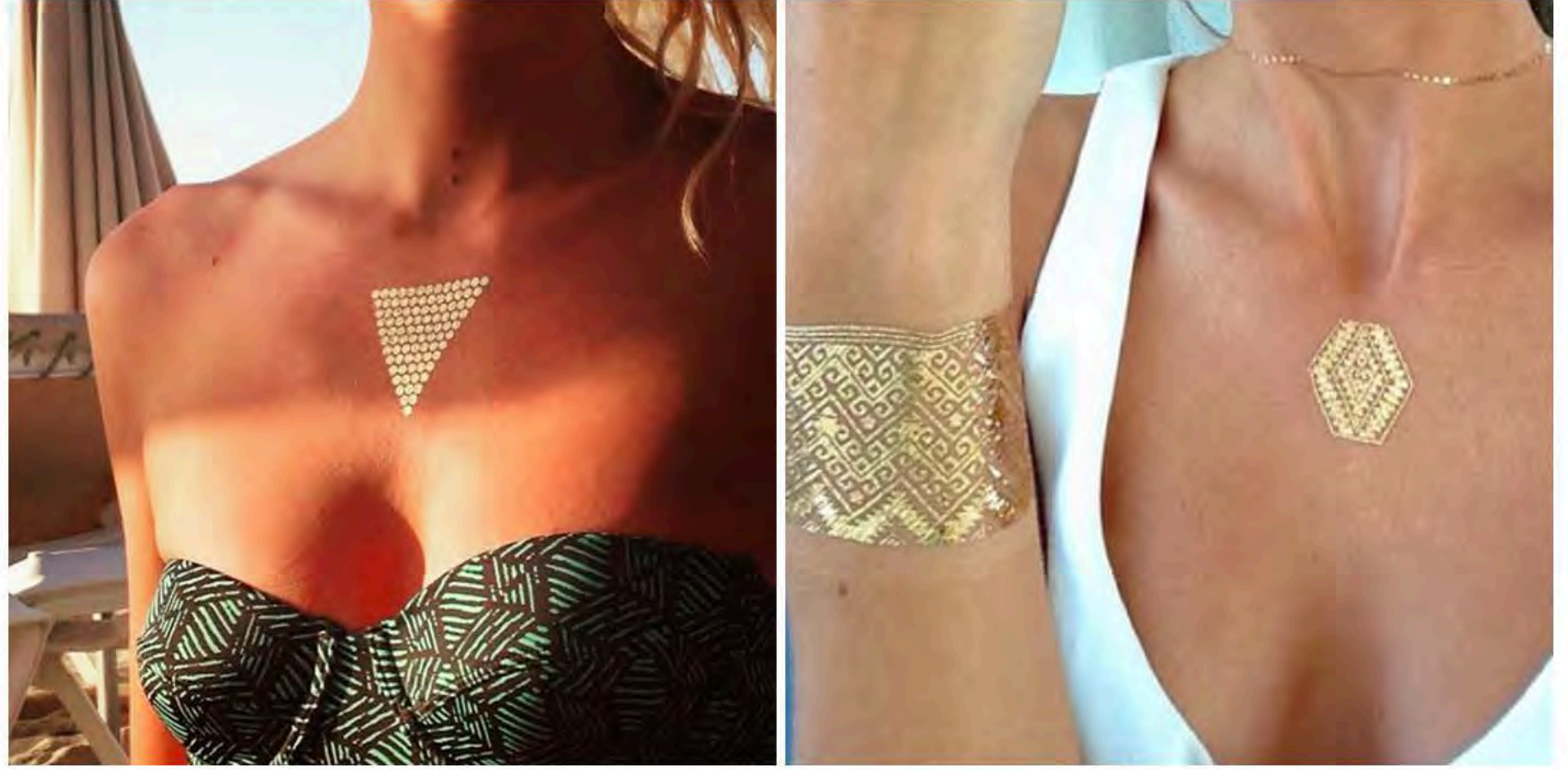
Stay Tuned For Food

( Bywhotattoo , Entre 22 et 26€ les planches de 8 à 30 bijoux)