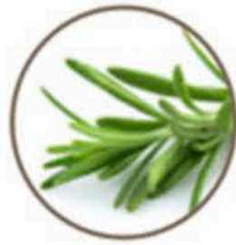
Romarin à camphre