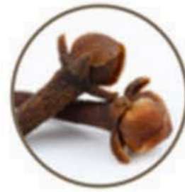
Clou de girofle