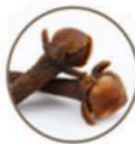
Clou de girofle