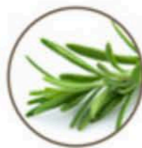
Romarin à camphre